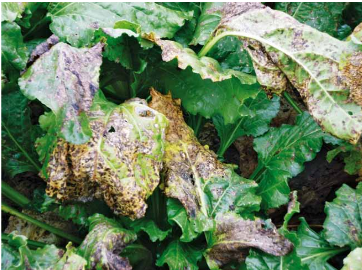
Abb. 2: Durch Cercospora -Befall kann nicht nur Blattfläche für die Ertragsbildung verloren gehen, sondern es kann in der Folge auch zum kompletten Blattwechsel der Rüben kommen.

in Niedersachsen, Sachsen-Anhalt, Mecklenburg-Vorpommern und den angrenzenden Regionen ist, dass dort die Cercospora selten bekämpfungswürdig auftritt. Im Süden Deutschlands kann es dagegen wie 2012 zum kompletten Blattwechsel der Rüben kommen mit entsprechend hohen Mindererträgen. Dort können in Befallsjahren bis zu vier Behandlungen speziell gegen Cercospora notwendig sein.